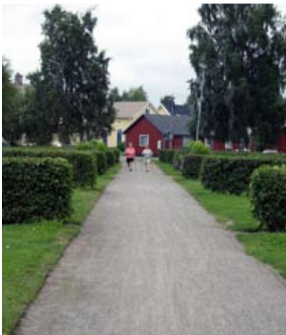
Häckar avgränsar utställningsytor

Nytt konstinköp planeras på årlig basis och detta gör att parken ständigt förändras och förnyas. Förutom den permanenta konsten kan här också arrangeras tidsbegränsade konstutställningar. Parkens uppbyggnad med naturliga utställningsytor omgärdade av häckar är exempel på dessa intentioner.