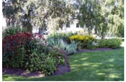
Perenner i Konstparken

Här ges främst regionala, men även andra konstnärer, möjlighet att ge uttryck för kreativt skapande med anknytning till kust, fiske och hantverk.